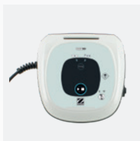
Boîtier de commande