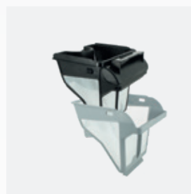
Bac filtrant Filtre double niveau : 150/60 µ