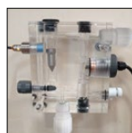
Sonde mesure chlore libre