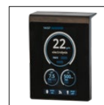
Écran tactile déportable