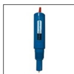
Kit ORP Sonde Goldline